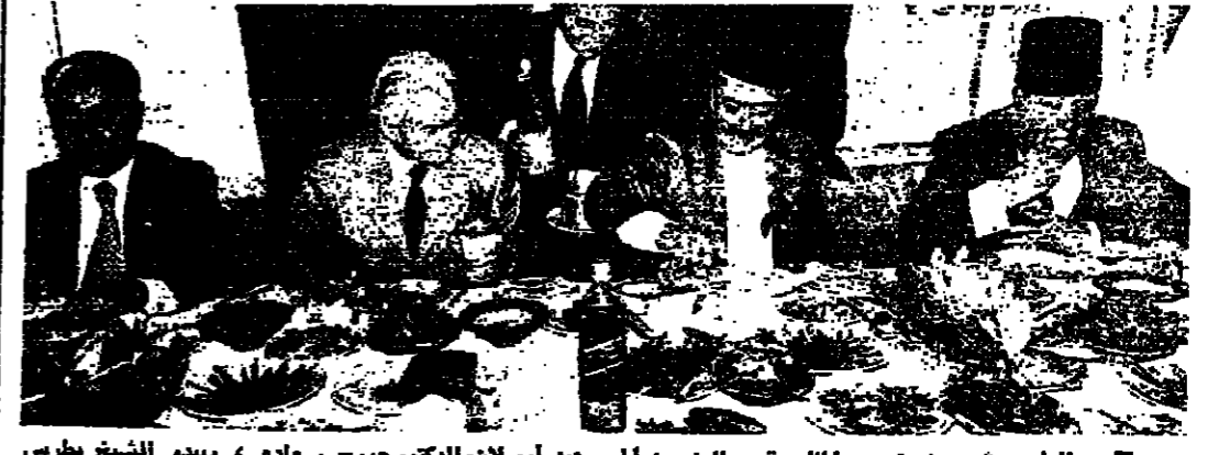
الرئيس شمعون بصرى المندوب مع الوزير امجد ارسلان والكورنيل سعادة ، ويبدو الشيخ بطرس الخوري